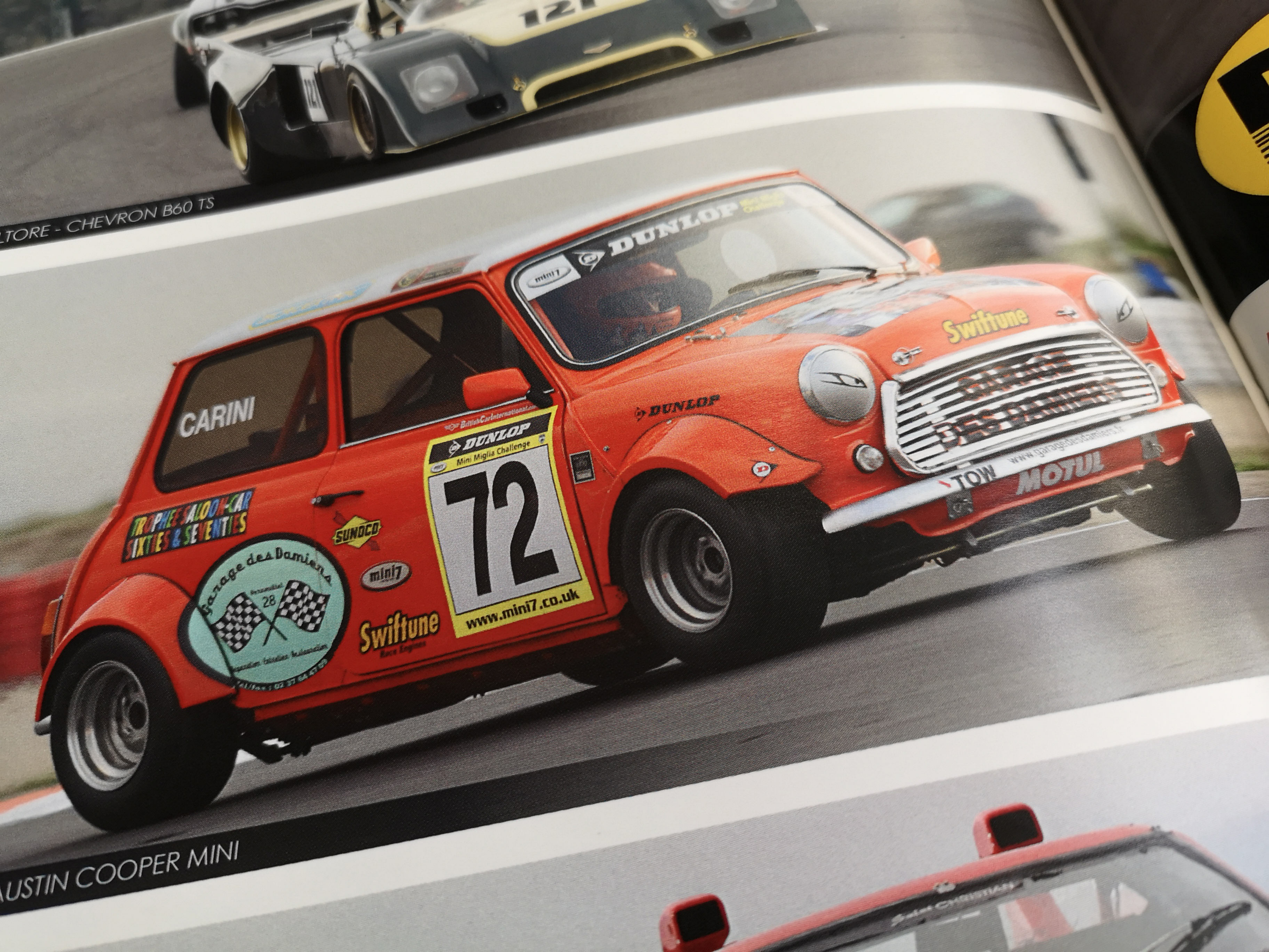
AUSTIN COOPER MINI