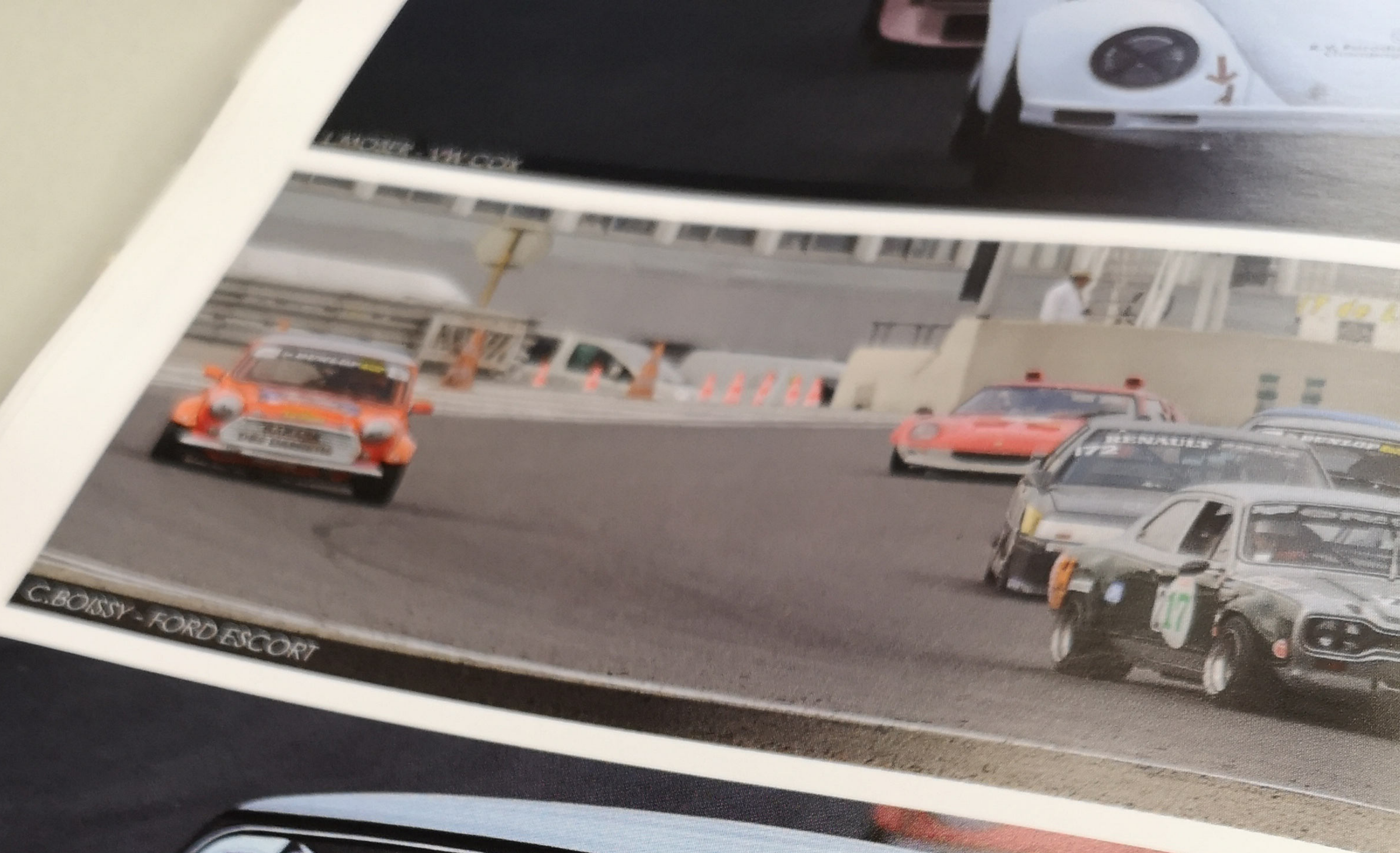
C. BOISSY - FORD ESCORT