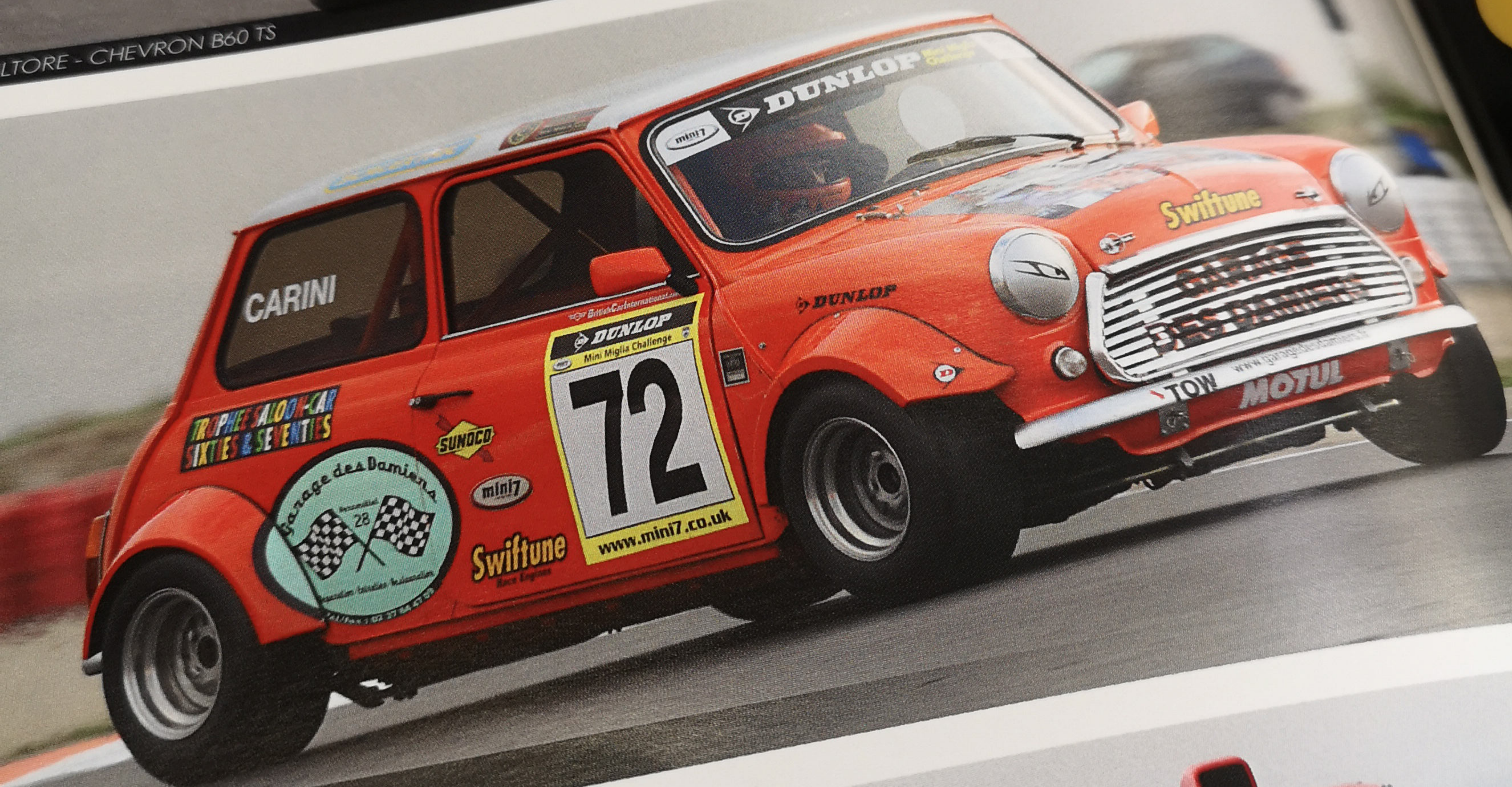
I - AUSTIN COOPER MINI