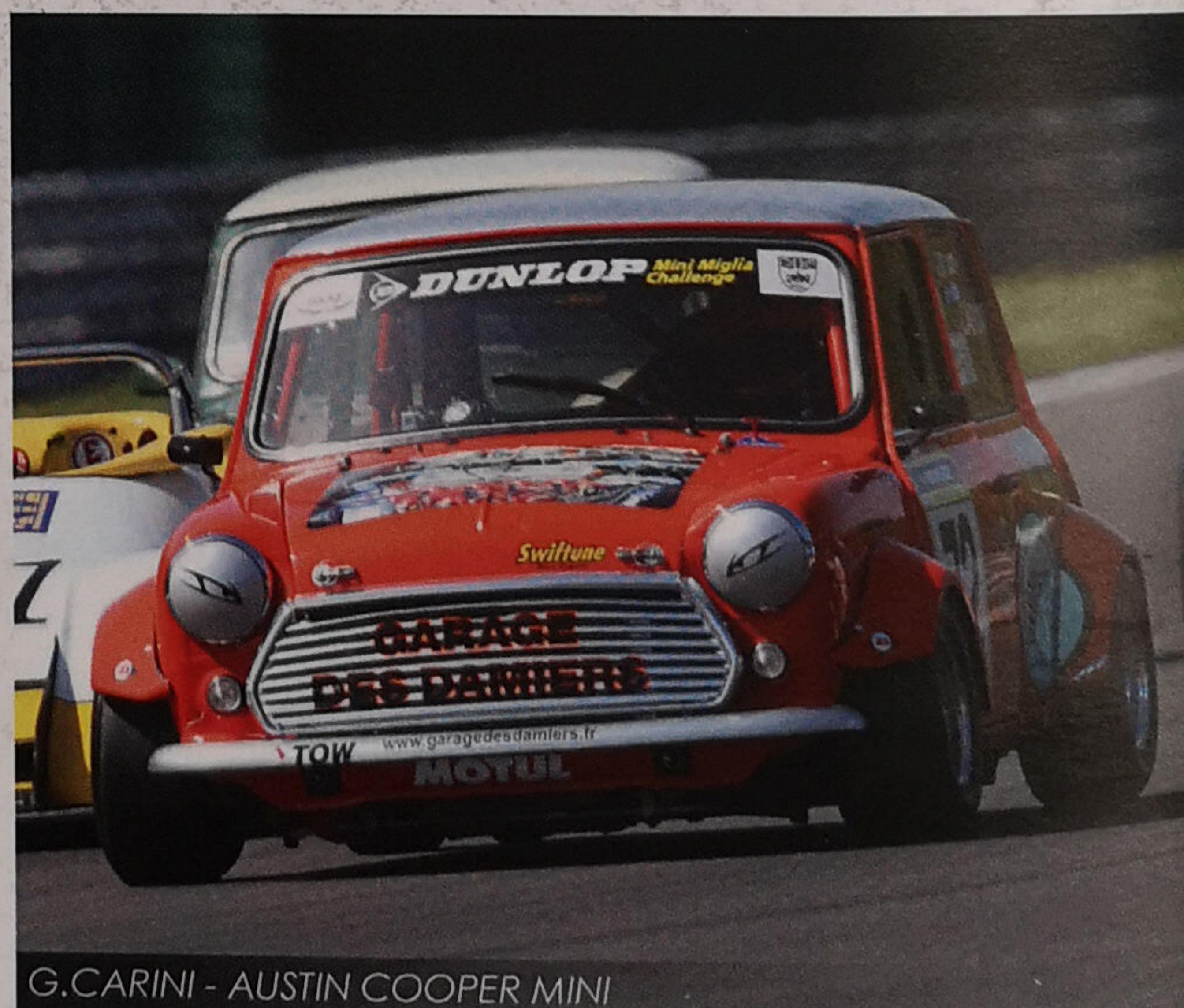
G.CARINI - AUSTIN COOPER MINI