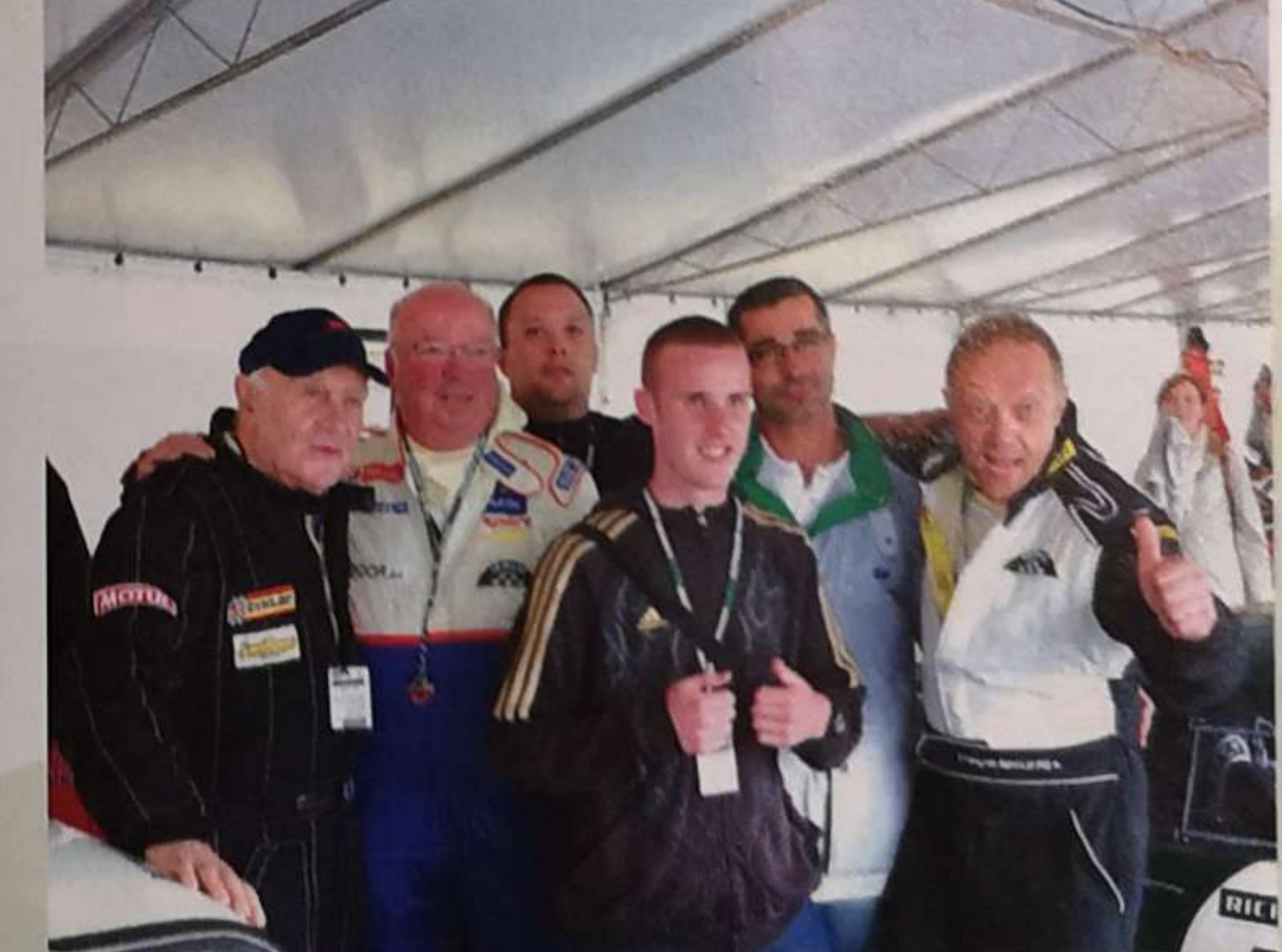
C'est toute un équipe qui se cache derrière cette Marcos.