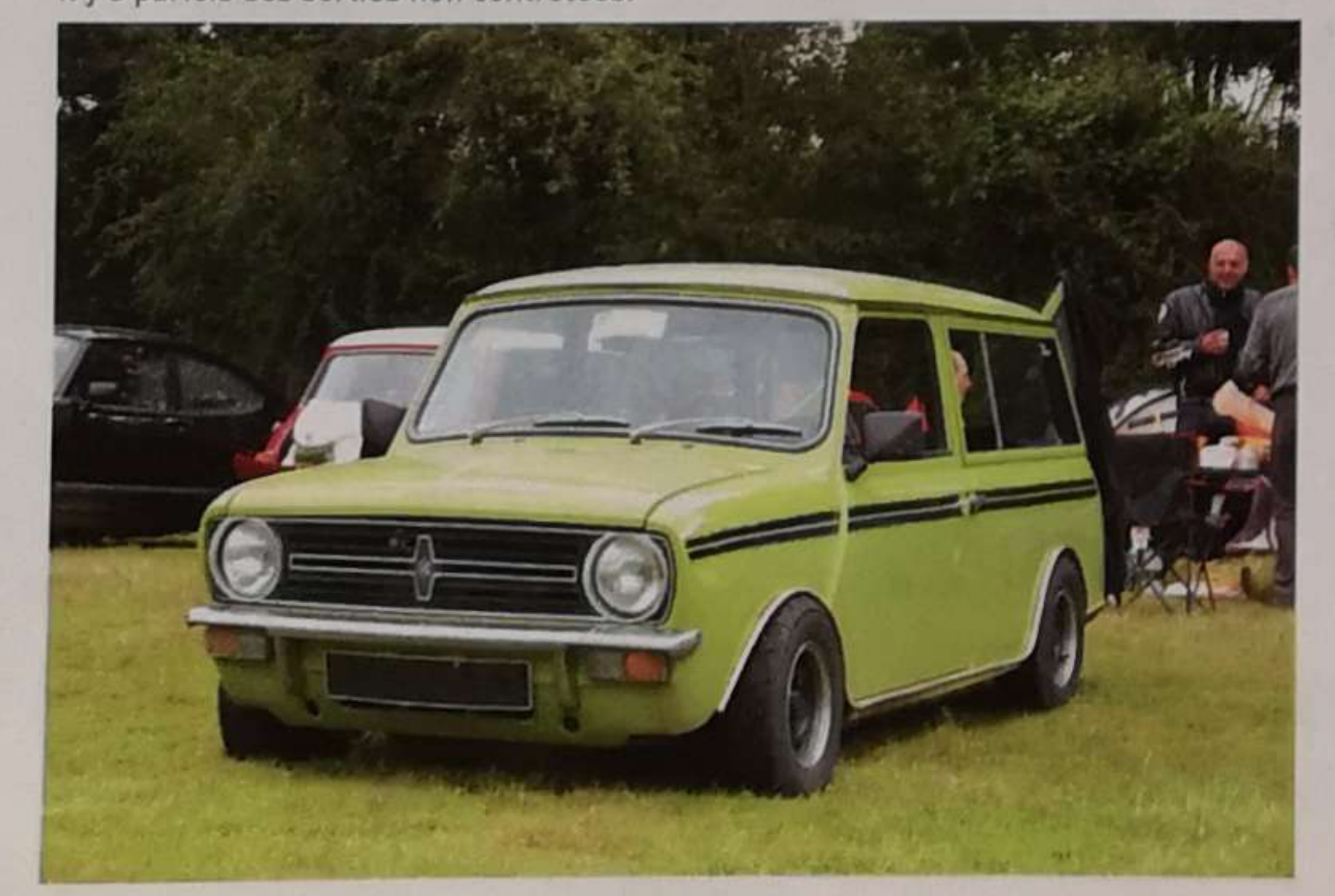
Le Mans Classic, ce sont aussi des moments de convivialité entre passionnés de Mini.