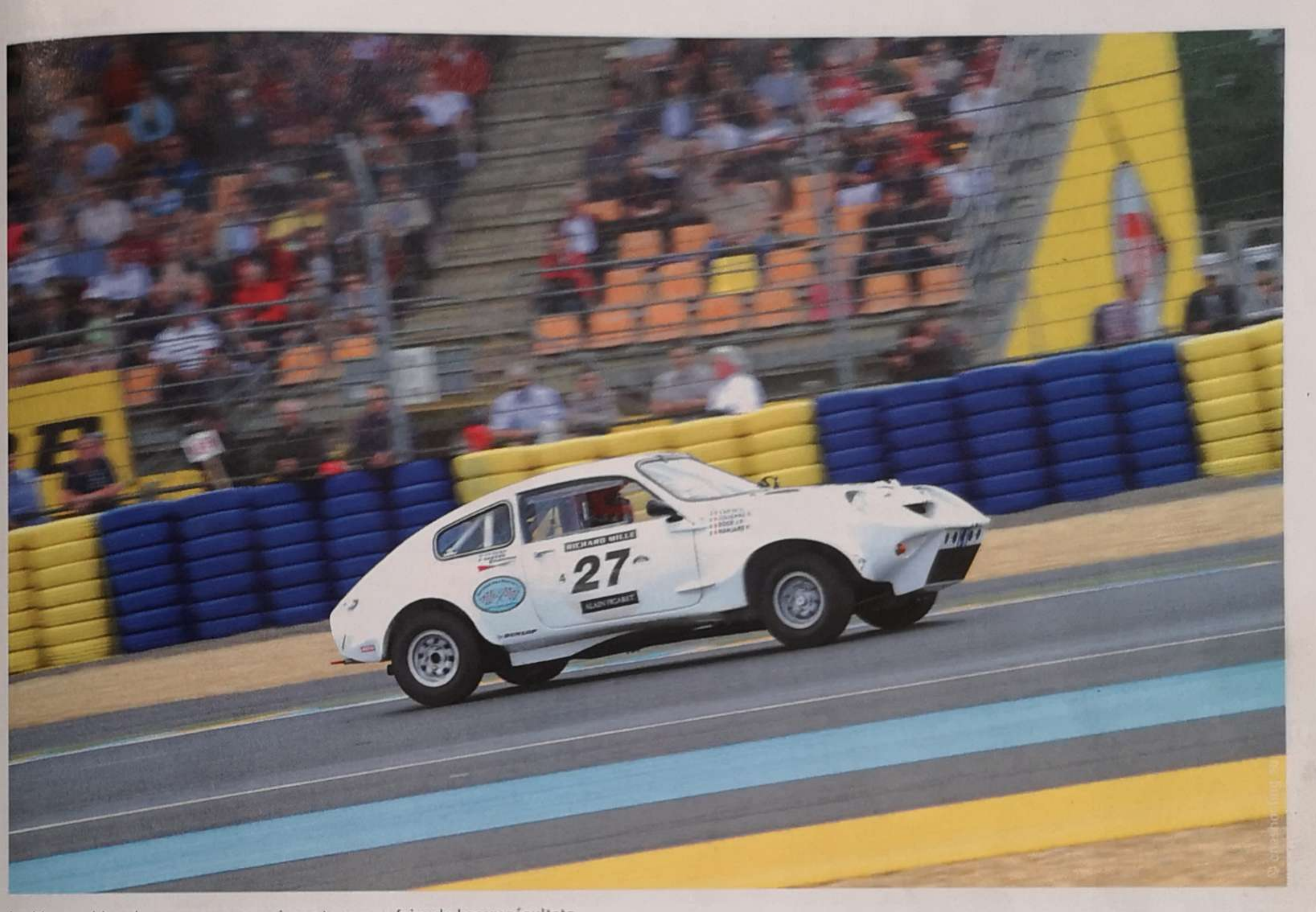
La Marcos blanche que vous connaissez tous a su faire de beaux résultats.