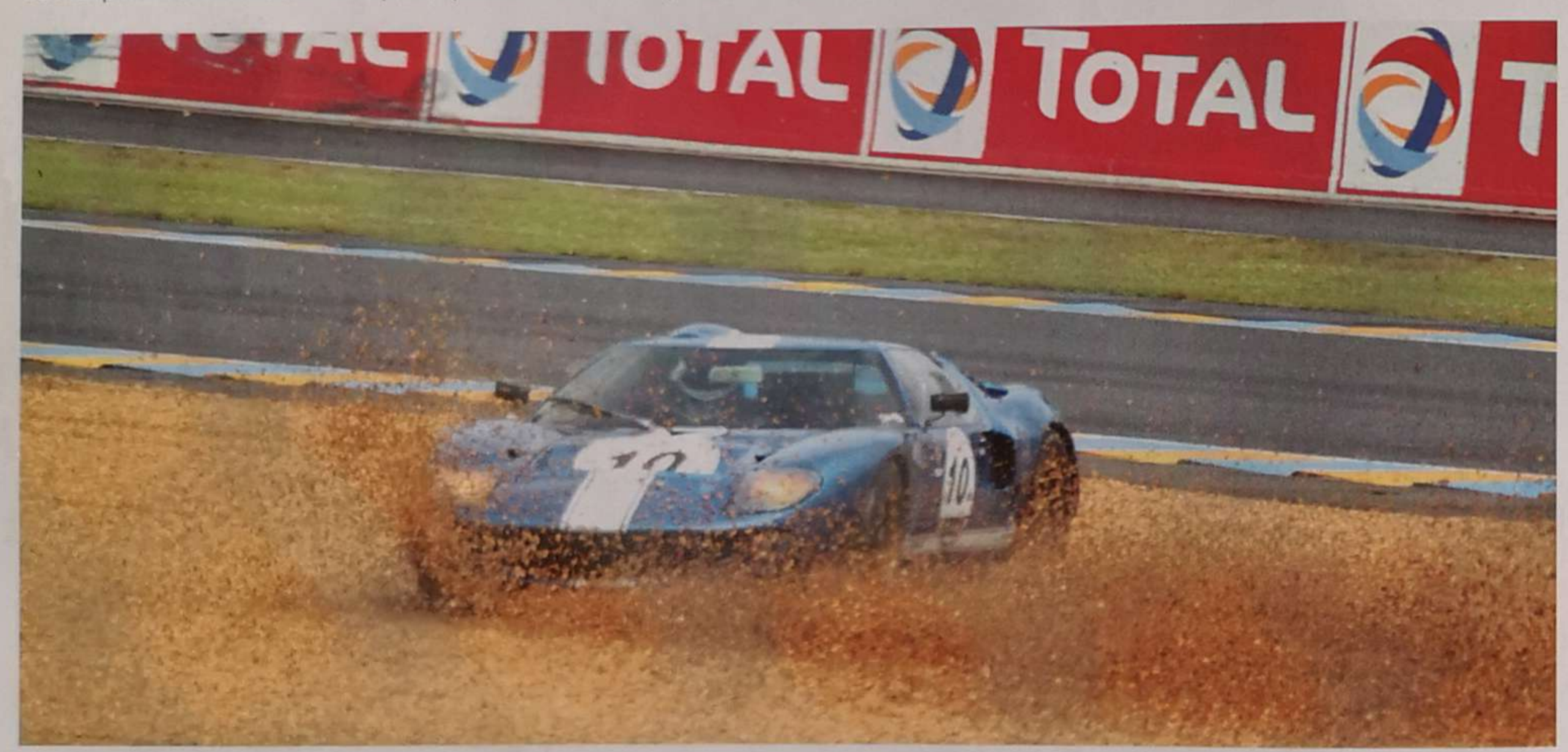
Il y a parfois des sorties non contrôlées.