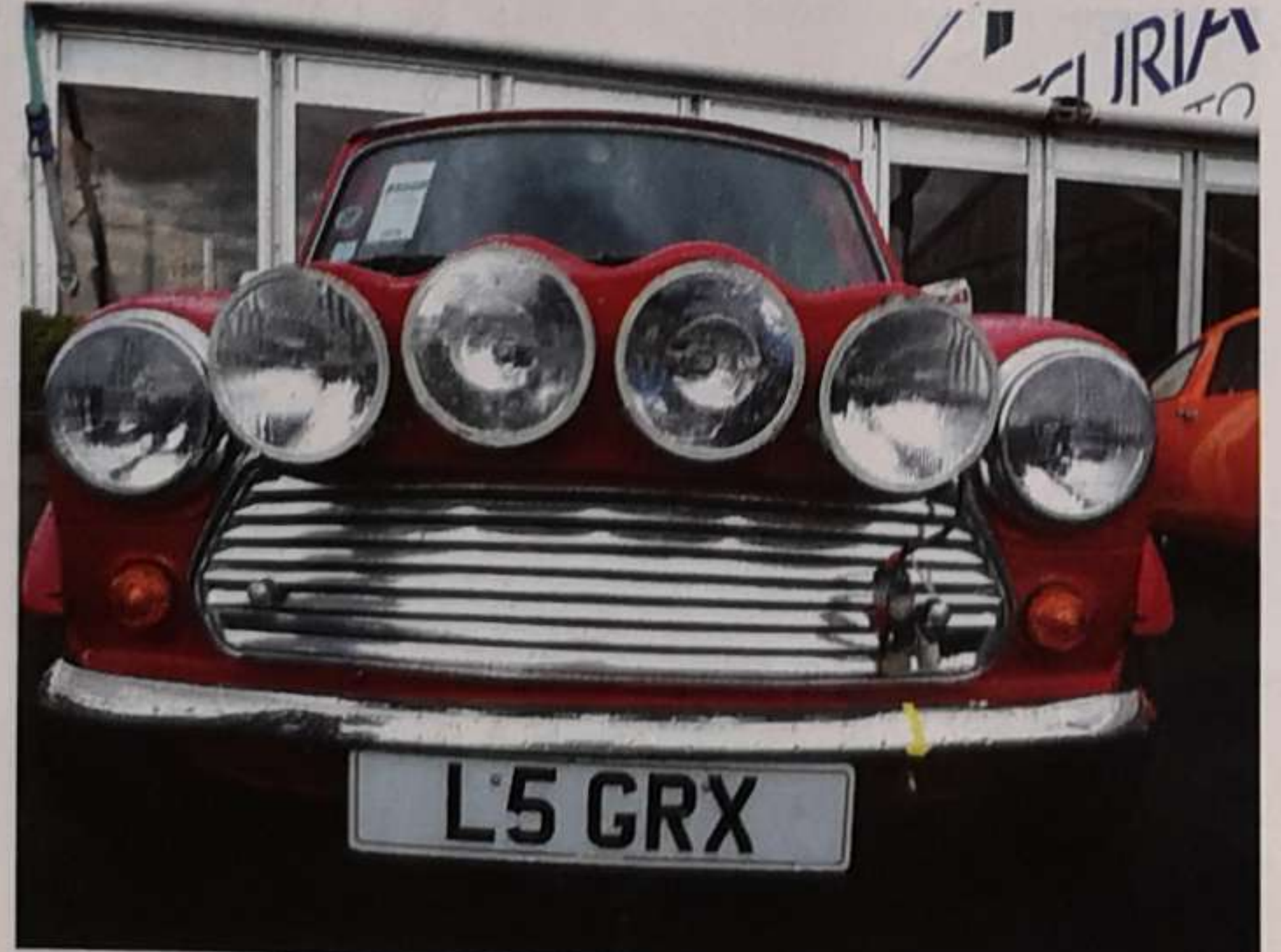
Au milieu de tous ces véhicules et bien d'autres, la Mini engagée par Rover France au Monte Carlo de 1994 fait partie de nos favoris...